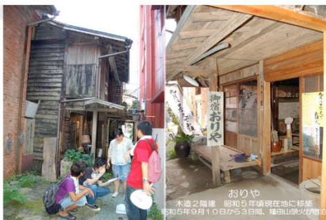
おひや 木造2階建 昭和5年頃現在地に移築 令和5年9月10日から3日間、熊本山県以作邸