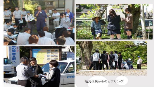
地元住民からのヒアリング