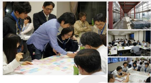
右上：取組開始時の現場 その他：ワークショップの様子