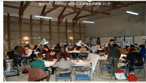
地元住民、八代市とのWSによる再生計画案づくり

主な担当科目：設計製図、建築設計演習、建築計画、景观工学、生産デザイン論 主な研究：建築外部空間の構成要素、グループワーク環境、歴史的建造物の保存再生、Shop House