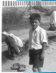
琴平小学校 低学年