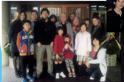
帝国ホテルでの 長男 卒業 謝恩会